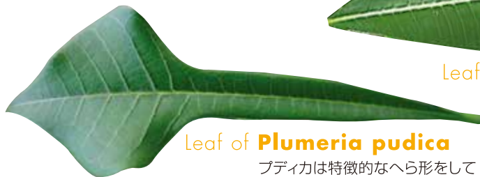
Leaf of Plumeria pudica