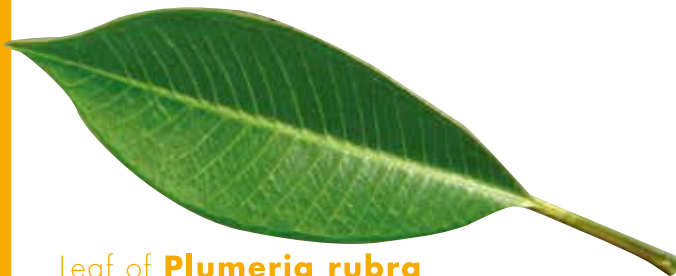
Leaf of Plumeria rubra