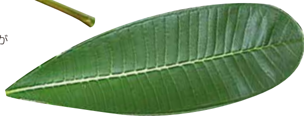
Leaf of Plumeria obtusa